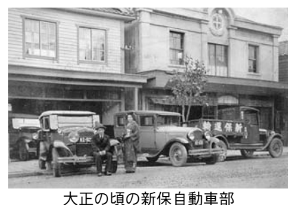
大正の頃の新保自動車部

いつも御利用いただきありがとうございます。新興タクシーは、その前身である新保本店運送部が新潟で産出する石油等の輸送業務を馬車から自動車へ移行するに際し、トラックを導入したのが大正8年といわれます。戦後の中断期を含め100年にわたり、ふるさと新潟で自動車輸送業に携わって参りました。