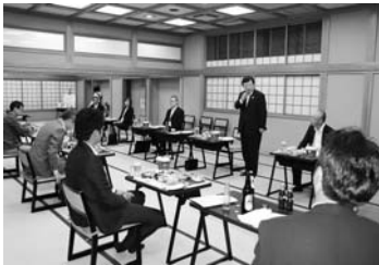
三密を避けての懇談会

県内では、緊急事態宣言が解除され、ウイルス感染症も終息の方向が示されています。しかしながら飲食業界では厳しい状況が続いたままです。こうした状況を受け、