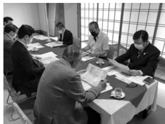
三密を避けての議員総会

また、総会に先立つ6月11日には、常議員会が周知なコロナ対策を施したうえで開催され、今回の総会に上程される諸議案が承認されています。