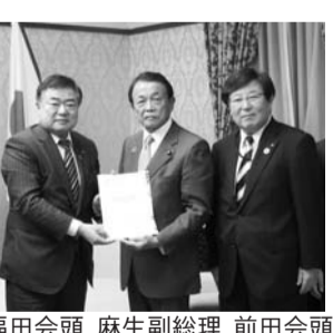
福田会頭 麻生副総理 前田会頭

11月11日、新潟県と新潟県商工会議所連合会(県連)は、財務省と国土交通省を訪れ、「令和3年度道路関係予算確保および高速道路等の整備促進に関する要望書」を提出しました。