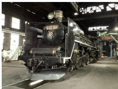
SL 検修庫・C57 180