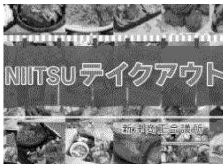
テイクアウトどっどこむ