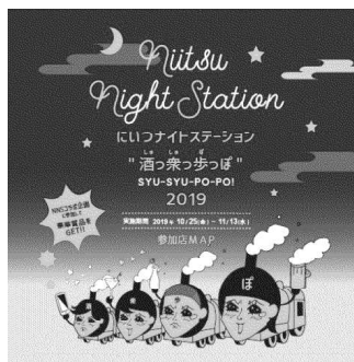
酒っ衆っ歩っぽ など