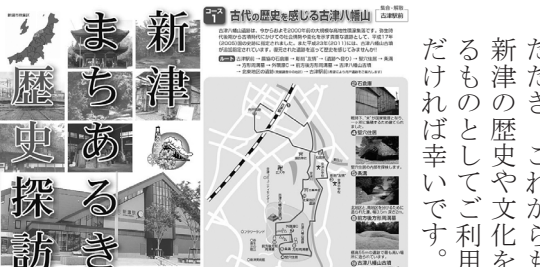
新津まちあるき歴史探訪(表紙、コース1)

3月28日(月)、新津観光協会では、令和3年度事業として実施する「観光解説板」の除幕式をJR新津駅東口広場において行いました。