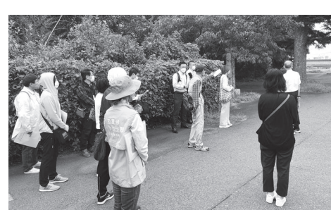
まちあるきの様子