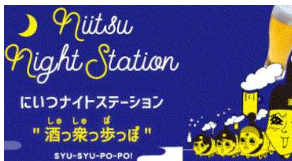
酒っ衆っ歩っぽ ほか