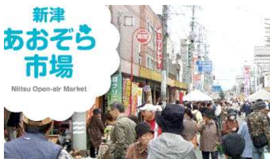
新津あおぞら市場