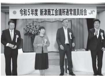
秋葉区市議団による乾杯

に開催されたにいつまちづくり会議全体会及び新潟薬科大学との三者協議会、5月の中原市長とのすまいるトークにおける大手食品製造業を誘致する食料基地構想の質問内容と回答、令和5年度新潟市施策要望の市からの項目別回答、8月の北陸地方整備局への要望内容等についての報告等がありました。