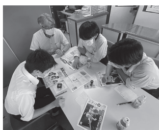
事業所訪問(インターンシップの様子)

目駐車場の環境美化活動、3日目は新津観光協会業務の研修をそれぞれ行いました。3日間の実習を経て、生徒さんからは「コミュニケーションの大切さを学ぶことができた」「社会人としての心構えを持つことができた」「仕事に取り組む姿勢の大切さを学んだ」「事業所の訪問で貴