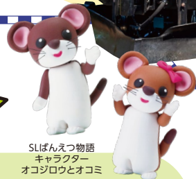
SLばんえつ物語 キャラクター オゴジロウとオコミ