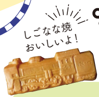
しごな焼 おいしいよ!