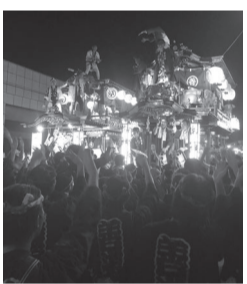
▲屋台まつりの様子

掉尾を飾る宮上りでは、屋台の引き回しや屋台同士の押し合いが白熱、ラストに本熊交差点で行われる七台の一斉あおりで、まつりは最高潮に達しました。