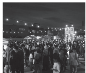
▲わっしょい広場の様子

協賛品の部 〔新津松坂流しご協賛事業所等〕 19日と20日には、勇壮な「屋台・たるみこしまつり」が引き手、見る人を魅了しました。「屋台まつり」は、新津の総鎮守「堀出神社」の大祭です。七つの町内が誇る絢爛豪華な屋台が、年に一度一斉にまちへ繰り出し、ところ狭しと町内の各所を練り歩きました。屋台まつりに合わせて、新津本町中央公園では「わっしょい広場(飲食物販)」も開催され、屋台まつりをさらに盛り上げました。