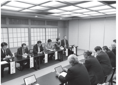
県議・市議との懇談会の様子

11月22日(水)、当所正副会頭と県議、市議との懇談会を開催しました。この懇談会は、当所が10月に新潟県及び新潟市へ令和6年度の産業政策要望を行ったことを受けて情報共有することを目的に開催しました。