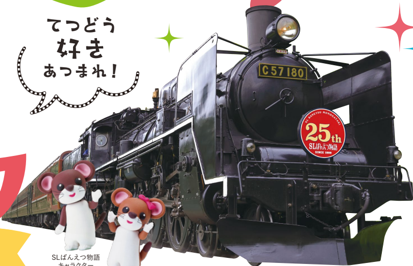
SLばんえつ物語 キャラクター オジゾロウとオジミ