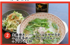
2 生春巻き+ハーフパパイアサラダ+野菜多めハーフとりのフォー+ドリンク1杯