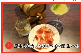
1 原木からカットのスペイン産 生ハム