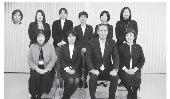
アクサ生命保険(株)新津営業所本部推進員