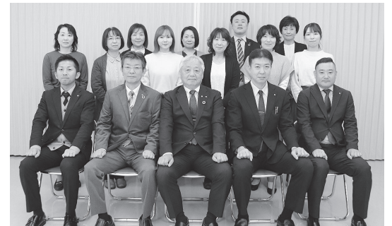
新津商工会議所職員