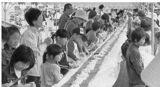
花ふるロールケーキ

「にいつ花ふるフェスタ」開催!! 5,200人が来場 今年で第6回目となった新潟地域の一大イベント「にいつ花ふるフェスタ」が、5月27日(日)に実施されました。当日は新潟地域の観光と文化施設のPRとともに、新潟市の中でも「新津」のいいところや独自の文化や伝統などアピールしました。