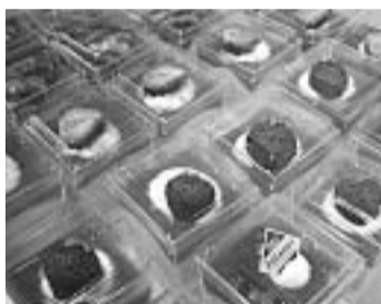
新津スイーツ (新潟菓子工業組合)