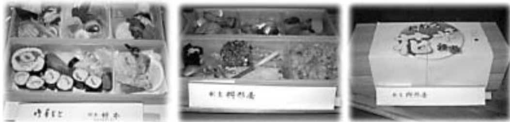
新津花弁当(新潟料理業組合)