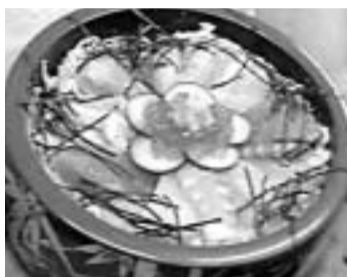
にいつ花チラシ丼 (新潟寿司組合)