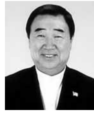
講師プロフィール