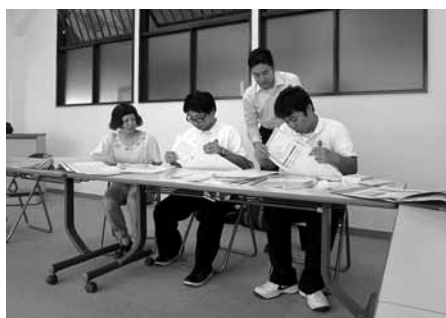
インターシップの様子

1日目は、商工会議所の業務と観光協会事業等について勉強し、2日目はまちの駅ぽっぽ及び当所会員事業所等への実地体験を行いました。