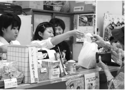
新津高校インターンシップの様子

でしたが、すぐに慣れてスピーディーに業務をこなしていました。新津工業高校のインターンシップは今年で6回目となりますが、1日目は商工会議所業務の研修と会員事業所の訪問、2日目は観光協会業務の研修と「まちの駅ぽっぽ」の体験実習、3日目は「昭和基地一丁目C57」の体験実習を行いました。商工会議所の業務は多岐にわたりますので、生