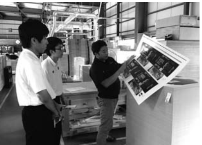
新津工業高校インターンシップの様子