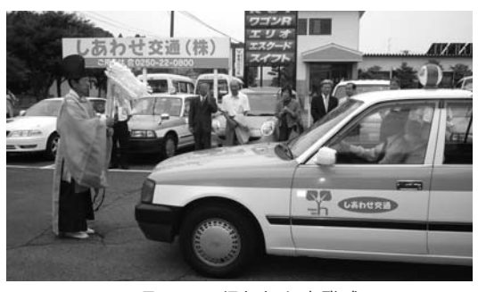
7月4日に行われた出発式

当社は、旧しあわせタクシーの従業員等が新会社「しあわせ交通(株)」を設立し、7月よりタクシー事業を開始いたしました。4月に裁判所から事業譲渡の許可を受け、6月中旬に国土交通省北陸信越運輸局から「しあわせ交通(株)」の営業認可を受けました。