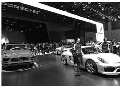
東京モーターショー