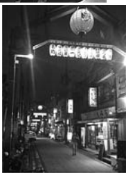
野毛商店街の風景