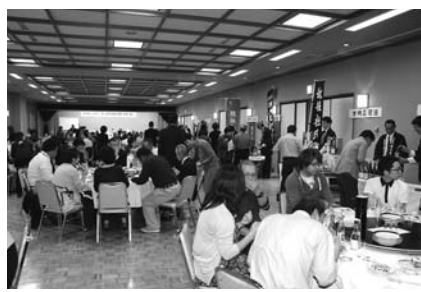
美味しい日本酒やお料理に舌鼓を打ちました