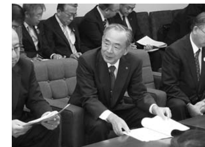
知事に要望する古川会頭

要望書は、県の2016年度予算編成に向けて取りまとめたものです。内容は、中小企業に対する支援施策、地域産業の育成・振興施策、社会資本の整備、観光振興などの項目により構成されています。