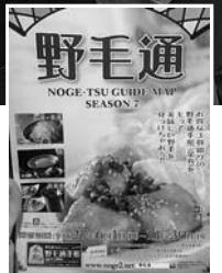
野毛通手形パンフレット