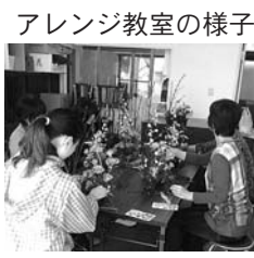
アレンジ教室の様子