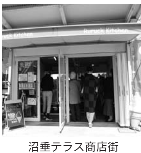
沼垂テラス商店街

新津商工会議所青年部・女性会ただいま会員募集中! 詳しくはホームページをご覧ください