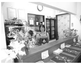
ご来店お待ちしております

お客様の要望にお応え した料理を提供したいと思 います。是非、ご来店・ ご予約を心よりお待ちし ております。 ・おまかせランチ ¥700 ・(コーヒー・デザート付き) ・コーヒー&デザートセット ¥500 ・コーヒー ¥300