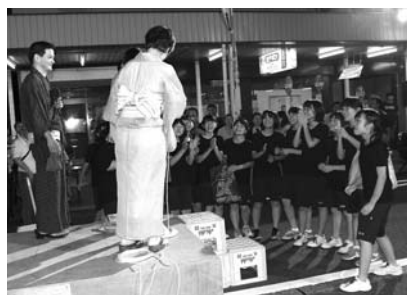
コンテストで受賞した新津第五中学校吹奏楽部

沿道では「松坂流し」のしなやかな手さばきを一目見ようと大勢の見物客が詰めかけ、声援を送りました。