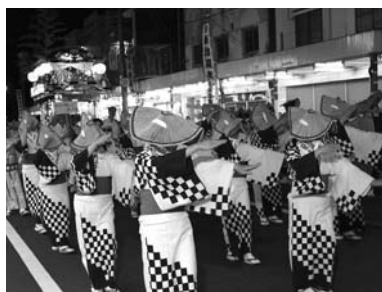
松坂流しに参加する女性会の皆さん

8月16日(火)、新潟の宝である新潟松坂流しに会員13名で参加致しました。今年で新潟松坂流しに参加するのは5回目となりましたが、今回は前回より正確に美しく踊れるように、7月から練習に励み、当日は女性会でお揃いの浴衣に編み笠を被り、約1,000名の踊り手と共に新潟本町通りを華麗に踊り歩きました。練習の成果もあり、着付け